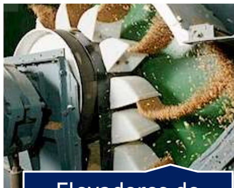
Elevadores de canecas

Transportadores de correia e transportadores helicoidais possuem limitações. Para os TC's vimos que em transportes verticais é imprescindível a utilização de correias aletadas e que os Transportadores helicoidais não são adequados para transportes pesados. Para vencer essas dificuldades utilizamos os elevadores de canecas, que conseguem efetuar transportes verticais com eficiência e economia de custos e espaço físico.